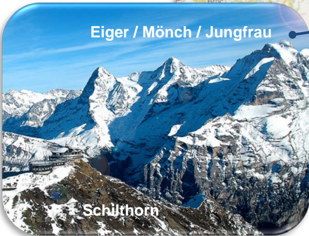
Eiger / Mönch / Jungfrau