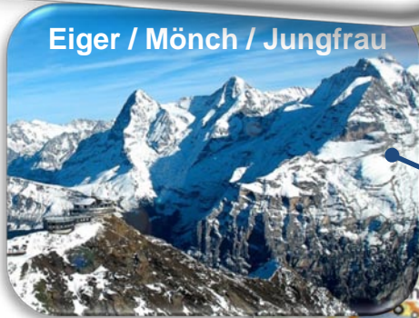
Eiger / Mönch / Jungfrau